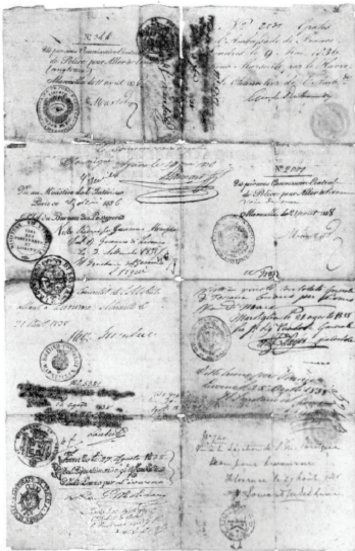
Fac-similé du Passeport de Louis-Thomas Budd en 1836