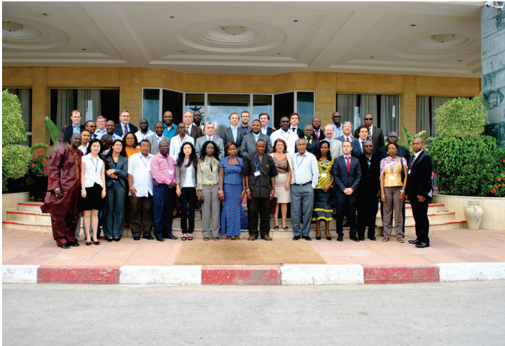
Séminaire Groupe Budd - Tunisie – 2010